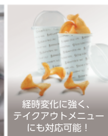
経時変化に強く、 テイクアウトメニュー にも対応可能！