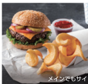
メインでもサイドでもバツグンの存在感

コンクエスト・デリバリープラス ジュニアサイドワインダー 従来のサイドワインダーより サイズ感を一回り小さくし、 バラつきを抑えた新サイドワインダー