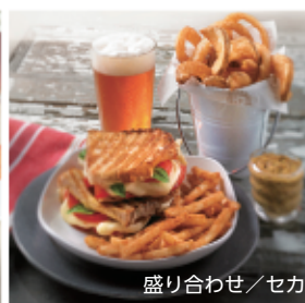
盛り合わせ／セカンドフライの一品に